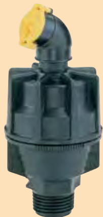
No regulado (base negra)