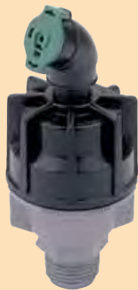
Regulado (base platada)

Aplicaciones: cultivos de campo, invernaderos, uso residencial y paisajismo