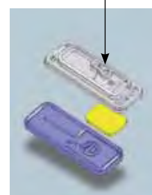
3 PARTES – VISTA SUPERIOR

Multicanal: tres entradas de agua dimensionales y once entradas independientes