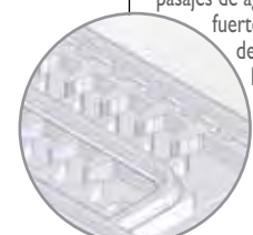
3 PARTES – VISTA INFERIOR

El laberinto de cascada con pasajes de agua anchos y fuerte operación de auto limpieza